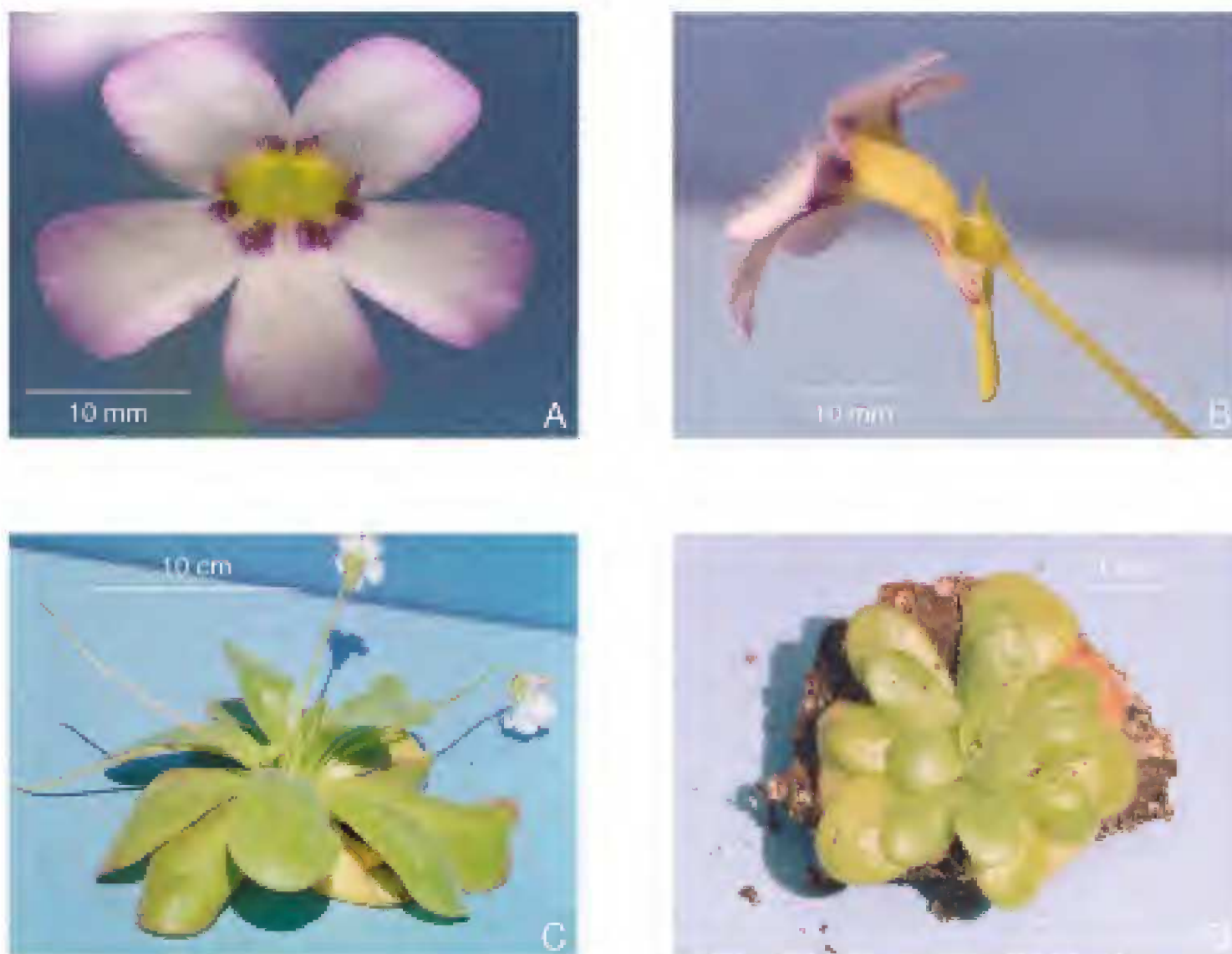
Fig. 2. Pinguicula ibarrae Zamudio. A. Flor muy colorida vista de frente; B. Flor vista de lado, se aprecia la pubescencia de la cara interna de los lóbulos de la corola y el espolón largo; C. Planta con hojas de “verano” y flores; D. Planta con hojas de “invierno”.

rosetas de “verano” de 6 a 18 cm de diámetro, formadas por (8)10 a 20 hojas membranáceas, adpresas al suelo, de color verde pálido, obovado-espátuladas, de 35 a 95 mm de largo, por 15 a 45 mm de ancho, redondeadas en el ápice, margen involuto, glandulosas en las 2/3 partes de la cara superior, cubiertas densamente con glándulas sésiles y glándulas estipitadas; hibernáculo ausente; pedúnculos 5 a 12 por temporada de floración, erectos, de 60 a 150 mm de altura, \pm 4 mm de diámetro, verdes pálidos, cubiertos densamente con glándulas estipitadas de 0.5 a 1 mm de largo, así como de glándulas sésiles, unifloros; flores de 24. a 35 mm de largo (incluyendo el espolón); cáliz bilabiado, verde brillante, cubierto con glándulas estipitadas en ambas caras; labio superior trilobado, dividido hasta 1/2 o 2/3 de su longitud, lóbulos triangulares a ampliamente elípticos, agudos, de 3.5 a 6 mm de largo, 2 a 5 mm de ancho; labio inferior bilobado, dividido hasta 1/2 o 2/3 de su longitud, lóbulos oblongo-elípticos a angostamente elípticos, agudos, de 3 a 5 mm de largo,